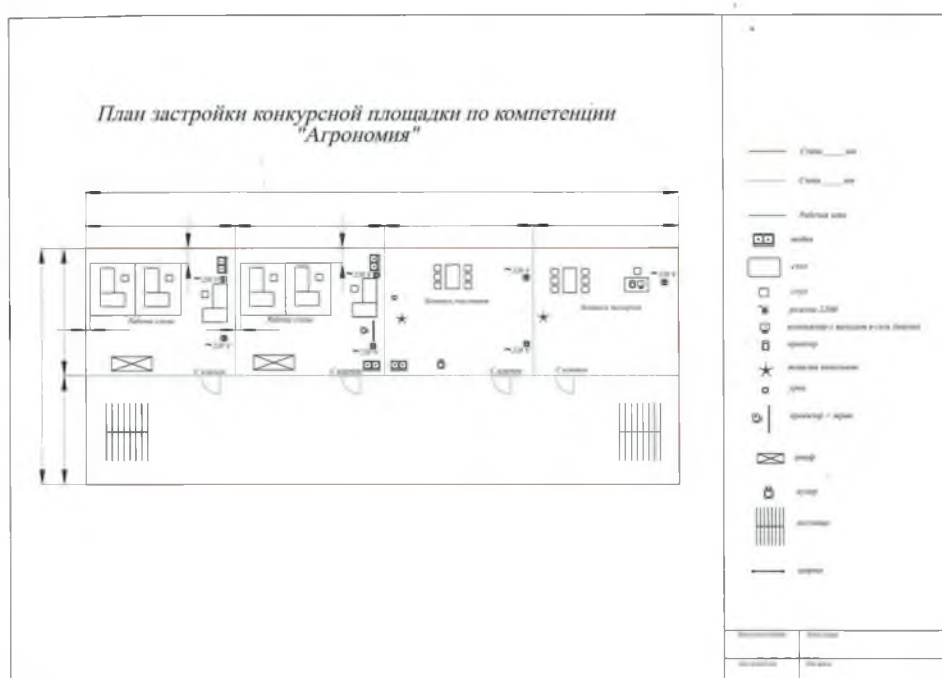
Схема конкурсной площадки (см. иллюстрацию).